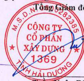
Trần Xuân Bản